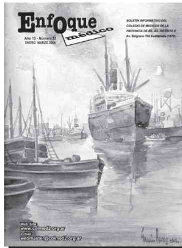
“Llegando a Puerto” Juan José García Pérez 1984

Todo comunicado, información o resolución publicado en este medio, tiene carácter de conocimiento obligatorio por parte del colegiado. Es de cumplimiento estricto por parte de cada médico inscripto en la matrícula de este Colegio de Distrito.